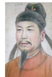
柳公权 唐代书法家