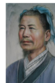
范宽 北宋山水画家