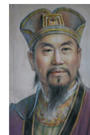
令狐德棻 唐代著名史学家