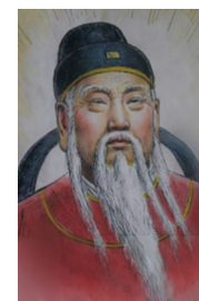
孙思邈 唐代大医药学家